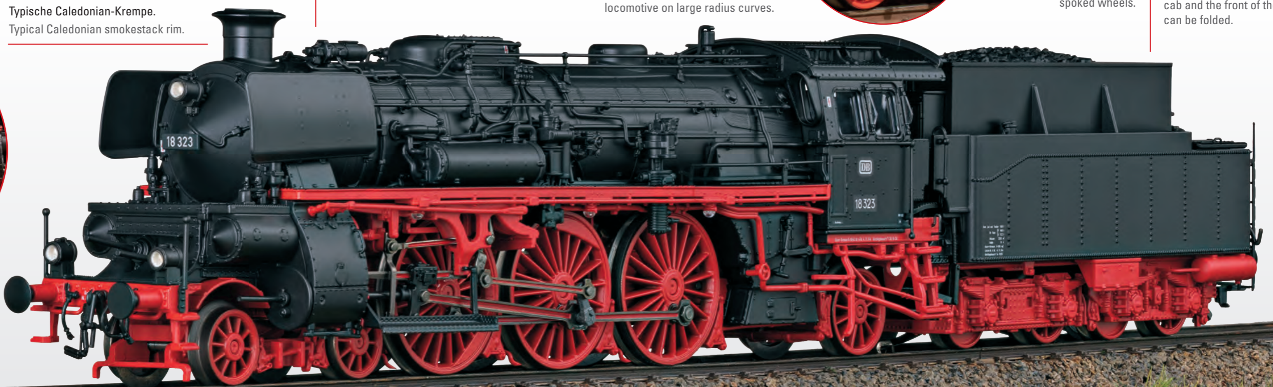
Typische Caledonian-Krempe. Typical Caledonian smokestack rim.

Das Übergangsblech zwischen dem Führerhaus und der Vorderseite des Tenders lässt sich umklappen. The walkover plate between the cab and the front of the tender can be folded.