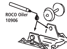
ROCO Oiler 10906

Les pièces de finition illustrées sont à monter par le modéliste. Le jeu de pièces peut comprendre d'autres pièces (non illustrées) qui sont destinées à autres versions du modèle et qui sont superflus à la variante présente.